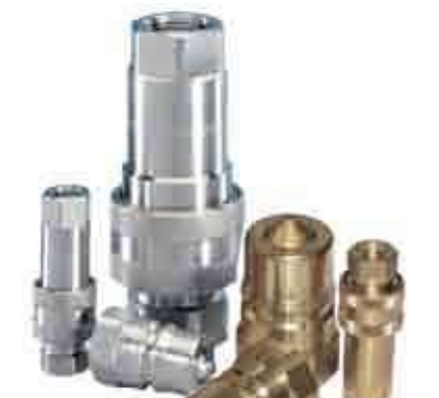
Серия: IRBX / IRBO

Серия быстроразъемных соединений седельного типа «IRB» взаимозаменяемы по международному стандарту ISO 7241-1 «B», производится из углеродистой стали с оцинковкой. Основываясь на всемирной взаимозаменяемости, «IRB» используется в многообразии промышленного комплекса. Взаимозаменяемость: ISO 7241-1 серии «B».