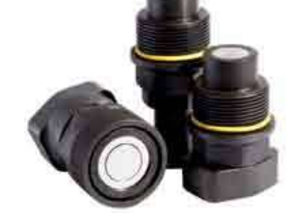
Серия: VEP-HD / VEP-HD под фланец (вида)

Серия быстроразъемных соединений «VEP-HD» с запорной площадкой резьбового типа это очередной пример постоянного совершенствования технологий Stucchi. Предназначена для систем с тяжелым режимом работы, высоким рабочим давлением, высокой частотой пульсаций и механическим напряжением. Соединения «VEP-HD» изготавливаются из углеродистой стали с высоким сопротивлением, обработанной при использовании азотирования, для увеличения сопротивления износу. Серия была протестирована 1'000'000 циклов пульсаций. Структура тройного клапана позволяет безопасно подключаться к системе, даже при высоком остаточном давлении и в то же время исключать внешние утечки жидкости в процессе подключения/отключения. Взаимозаменяемость: внутренняя конструкция Stucchi.