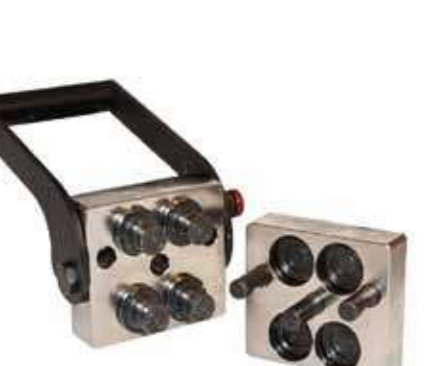
Серия: БАТАРЕЙНОЕ СОЕДИНЕНИЕ DP

Серия «GR» это ручное мультисоединение, предлагающее широкий диапазон решений, в системах требующих подключения и отключение нескольких гидравлических, электрических и пневматических линий. До десяти линий могут быть одновременно соединены или разъединены безопасным, простым и быстрым движением, не требующим особых усилий. Все линии могут иметь одинаковый размер или различаться согласно схеме. Взаимозаменяемость: внутренняя конструкция Stucchi.