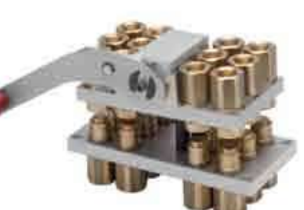
Серия: БАТАРЕЙНОЕ СОЕДИНЕНИЕ GRE

Серия «GRE» это мультисоединение, предназначенное для ручного подключения/отключения нескольких соединений одновременно. Серия «GRE» предназначена для систем с низким рабочим давлением, где в качестве рабочей среды используется воздух или вода. Рабочее давление до 10 бар. Плиты GRE доступны с размерами муфт 6, 12 или 18, установленных на плите. Преимущества включают в себя: - БРС выполнена из латуни, годной для работы с воздухом или водой; - Надежная и компактная конструкция; - Простота установки и смены муфт при монтаже; - Ручка подключения позволяет легко подключать/отключать до 18 муфт одновременно; - Система с автоматическим защелкиванием исключает случайное отсоединение; - Исключение скрепления линий системы, эффективность при смене инструмента. Взаимозаменяемость: внутренняя конструкция Stucchi.