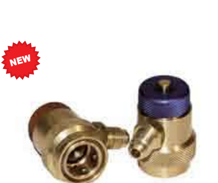
Серия: SSB - SSR

Серия быстроразъемных соединений резьбового типа «IV-HP» с шариковым клапаном, предназначена для систем с высоким рабочим давлением до 700 бар/10000 пси. БРС изготавливается из высококачественной углеродистой стали с оцинковкой. Взаимозаменяемы с однотипными соединениями, существующими на рынке и в основном используются для гидравлических домкратов и цилиндров. Взаимозаменяемость: однотипные соединения.