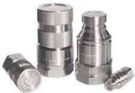
Серия: FL / AX

Серия БРС с запорной площадкой «FL» это конструкция Stucchi для систем, работающих в условиях высокой коррозионности и/или в агрессивных средах. Серия «FL» изготавливается из нержавеющей стали AISI 316 со стандартными уплотнениями из Витон/Фторуглерод. Возможны другие уплотнения на заказ, в зависимости от рабочей жидкости или температуры. Преимущество запорной площадки заключается в исключении утечек при подключении/отключении, снижении загрязнения в системе, оптимальном сопротивлении коррозии. Эти качества делают серию «FL» идеальной для применения в таких отраслях, как: морская, промышленная, химическая, фармацевтическая и пищевая. Взаимозаменяемость: ISO 16028 и NFPA T3.20.15 (HTMA).