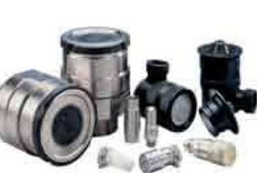
Серия: СПЕЦИАЛЬНЫЕ БРС

Компания Stucchi имеет огромный опыт в производстве обратных клапанов серии «VU». Клапаны имеют компактную, безопасную конструкцию, подходящую для гидравлических систем с неагрессивными средами. Серия «VU» предлагает широкий диапазон размеров от 1/8 до 2" со стандартным давлением открытия 5 пси (0.35 бар) и 65 пси (4.5 бар). На заказ доступны другие значения давления открытия.