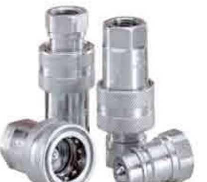
Серия: BIR / BIR-PC

Серия быстроразъемных соединений седельного типа «IR-V» взаимозаменяема с шариковой серией «IR» и изготавливается из углеродистой стали с оцинковкой. Особенность дизайна в усовершенствованном уплотнении шарикового запорного элемента. Размер 1/2 это часть серии «BIR» и взаимозаменяемость согласно стандарту ISO 7241-1 серии «А». Взаимозаменяемость: похожие серии БРС. ISO 7241-1 серия «А» (только для размера 1/2). Также доступна версия «IR» с уплотнением шарикового элемента.