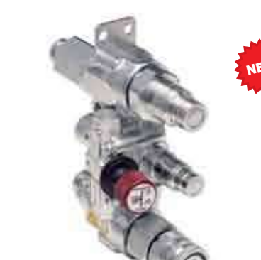
Серия: БЛОК SATURN

Серия быстроразъемных соединений «VEP-HD» с запорной площадкой резьбового типа это очередной пример постоянного совершенствования технологий Stucchi. Предназначена для систем с тяжелым режимом работы, высоким рабочим давлением, высокой частотой пульсаций и механическим напряжением. Соединения «VEP-HD» изготавливаются из углеродистой стали с высоким сопротивлением, обработанной при использовании азотирования, для увеличения сопротивления износу. Серия была протестирована 1'000'000 циклов пульсаций. Структура тройного клапана позволяет безопасно подключаться к системе, даже при высоком остаточном давлении и в то же время исключать внешние утечки жидкости в процессе подключения/отключения. Взаимозаменяемость: внутренняя конструкция Stucchi.