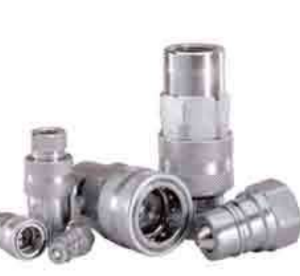
Серия: IR-V / IR

Серия «GRE» это мультисоединение, предназначенное для ручного подключения/отключения нескольких соединений одновременно. Серия «GRE» предназначена для систем с низким рабочим давлением, где в качестве рабочей среды используется воздух или вода. Рабочее давление до 10 бар. Плиты GRE доступны с размерами муфт 6, 12 или 18, установленных на плите. Преимущества включают в себя: - БРС выполнена из латуни, годной для работы с воздухом или водой; - Надежная и компактная конструкция; - Простота установки и смены муфт при монтаже; - Ручка подключения позволяет легко подключать/отключать до 18 муфт одновременно; - Система с автоматическим защелкиванием исключает случайное отсоединение; - Исключение скрепления линий системы, эффективность при смене инструмента. Взаимозаменяемость: внутренняя конструкция Stucchi.