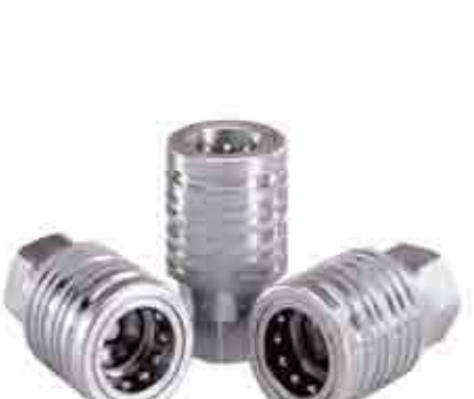
Серия: IRS-V / IRS

Серия быстроразъемных соединений, розеток, седельного типа «IP», с модульным дизайном и втулкой двойного действия для монтажа на плите, которая позволяет подключать/отключать БРС способом втапливания/вытапливания, действуя, как функция отключения линии. В основном используются в гидравлических системах сельскохозяйственных тракторов, где функция отключения требуется для предотвращения утечек при разрыве линии системы. Для присоединения к «IP» розетке используется вилка типа «I». БРС изготавливаются из углеродистой стали с оцинковкой CRIII и разрабатываются под модульный дизайн, с метрическими DIN резьбами, типа переходник, BSP, NPT или другие резьбы на заказ. Серии I и IP взаимозаменяемы по ISO 7241-1 A; доступны размеры до 1". (Примечание: Размер 1/4 I-IP 14 «D» тип не взаимозаменяем с ISO 7241-1 A). Взаимозаменяемость: ISO 7241-1 серии «А».