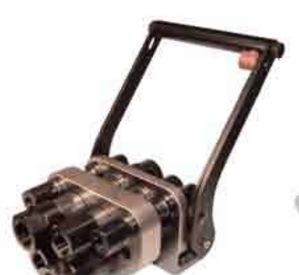
Серия: БАТАРЕЙНОЕ СОЕДИНЕНИЕ GR

Блок Saturn это последняя инновация Stucchi, соответствующая современным требованиям мобильной техники. Она суммирует в себе все решения и новинки, разработанные компанией Stucchi в течение многих лет работы в области гидравлических соединений. Спроектированная на опыте спроса рынка гидравлического оборудования и длительного сотрудничества с OEM производителями, система имеет встроенный клапан срабатывания остаточного давления, который позволяет подключать и отключать две линии с остаточным давлением, как розетку, так и вилку. Блок Saturn имеет модульный и удобный дизайн, снабженный запорной площадкой взаимозаменяемой по ISO 16028, позволяя исполнение с размером резьбы: 1/2, 5/8 и 3/4 (A13, A15 и A17) Взаимозаменяемость: ISO 16028.